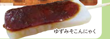
ゆずみそこんにやく