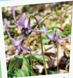
4月中旬カタクリの花が遊歩道のあちこちで見られます

遊歩道沿いにはカタクリの群生地があり、4月中旬にあちこちで可憐な花を咲かせます。また、山頂にある滝川の里周辺は水芭蕉の群生地。4月初旬になると真っ白な花たちが水辺に広がります。遊歩道に策さまざまな花を愛でながら渓谷歩きをお楽しみください。