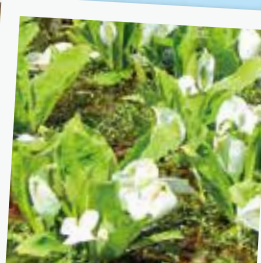
4月初旬に「滝川の里」周辺で水芭蕉が見頃を迎えます