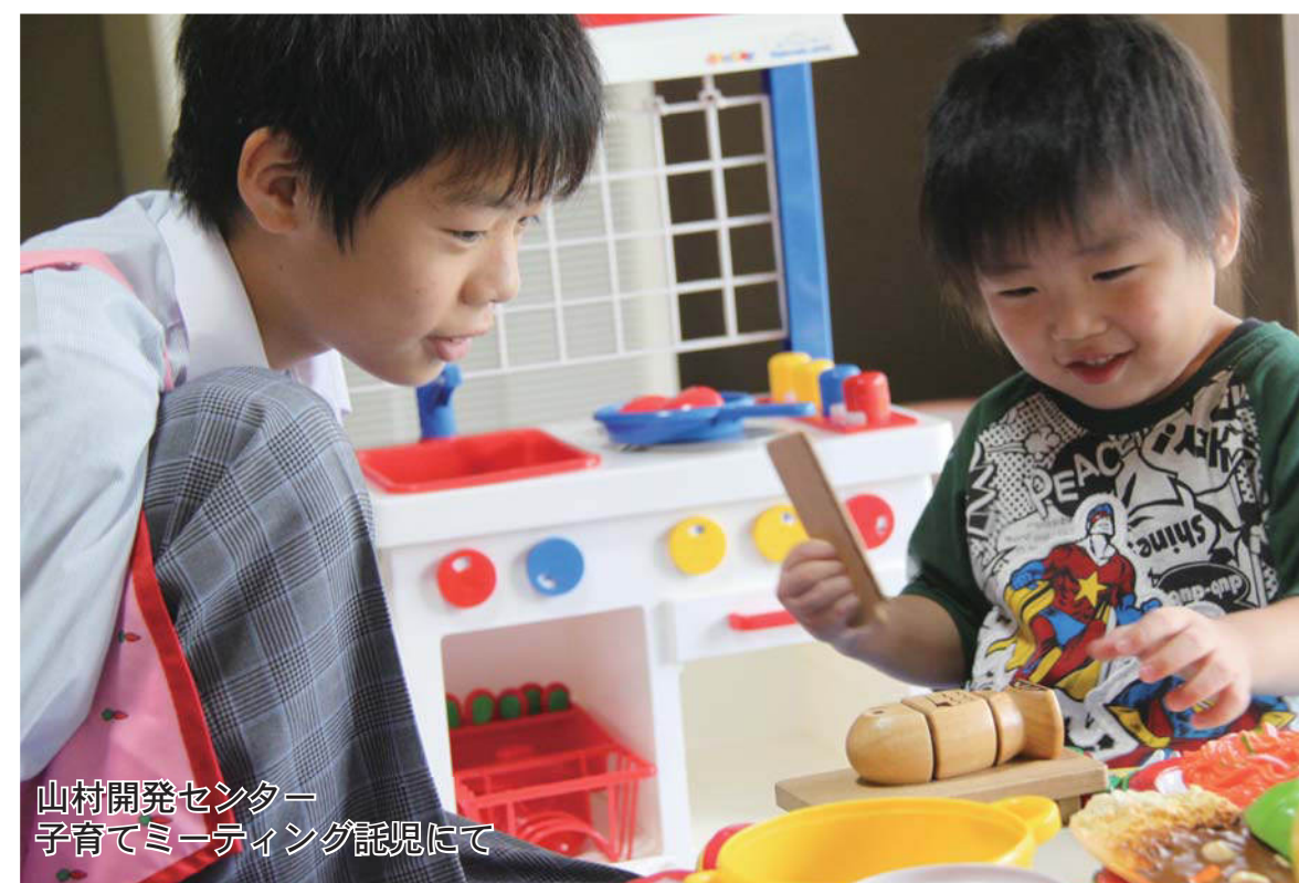
山村開発センター 子育てミーティング託児にて

矢祭中学校では9月10日～11日、町内22事業所において職場体験を実施しました。普段は机と向き合って勉強する毎日の子どもたちが、地域の職場に出て自分の夢や興味がある仕事と向き合い、仕事の大変さや、やりがいを見つけました。