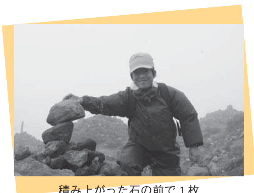
積み上がった石の前で1枚