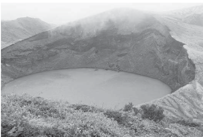
霧の中に出現したお釜

「よねおり観光センター」・「高畠ワイナリー」を見学し帰町しました。参加者は、普段見ることのできない高山植物や、平地との気温差など多くの自然を体験し、体力づくりや町民の交流だけでなく、自然を全身で体感するなどハイキングの醍醐味も味わうことができました。