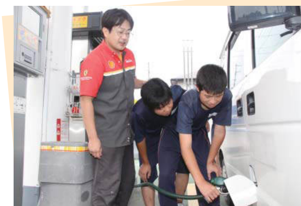
昭和シェル(株)小室商店