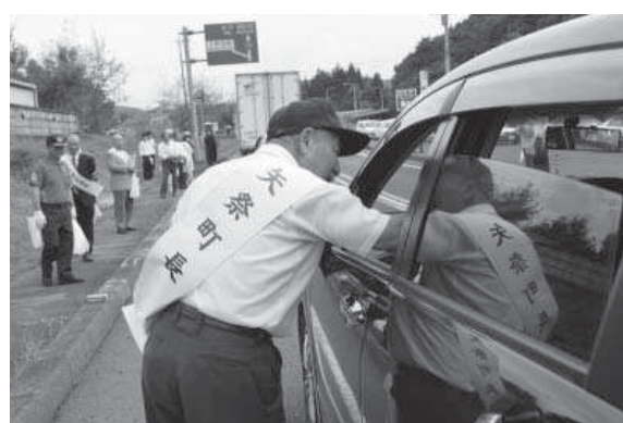
運転に気をつけて！

テント村では国道118号の両側から車を止めて、交通安全啓発のチラシや反射材がついたキーホルダーなどを配布し、秋の全国交通安全運動期間中の無事故を願いました。