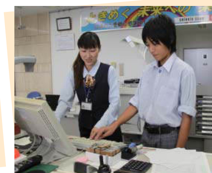
白河信用金庫矢祭支店