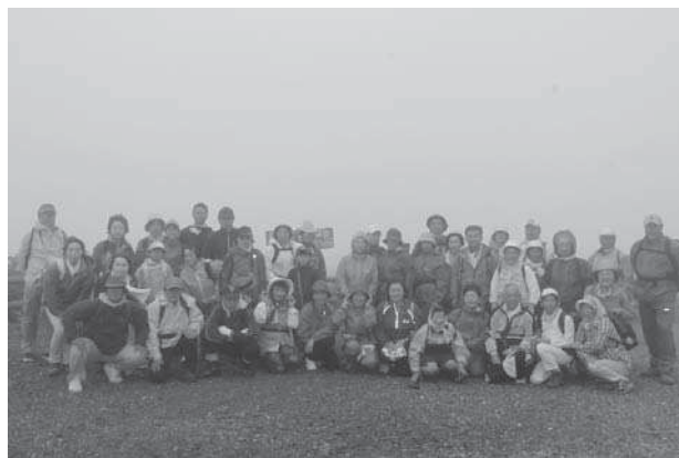
集合写真の中の1枚