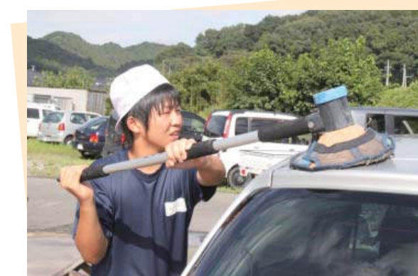
矢祭自動車整備工場