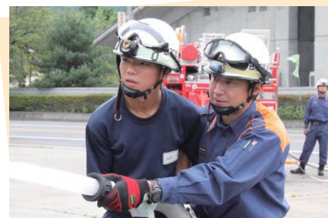
棚倉消防署 矢祭分署